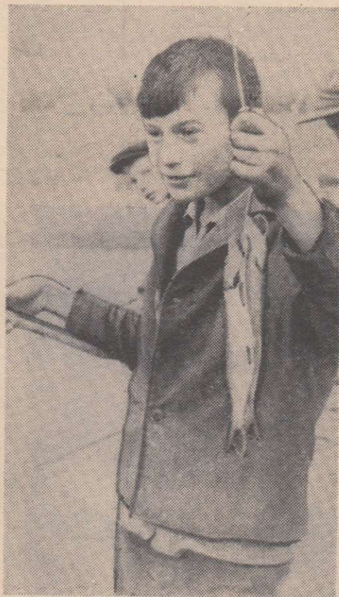
БОГАТЫЙ УЛОВ.